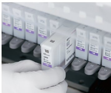
Reagentes prontos para uso e de fácil carregamento