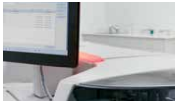
Luz de Status do sistema