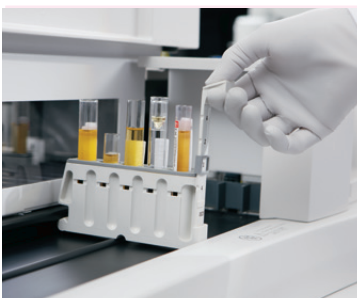
STAT Port para processamento imediato