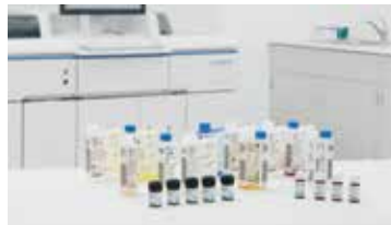
Tamanhos flexíveis de reagentes

Interface intuitiva simplificando a operação e o treinamento